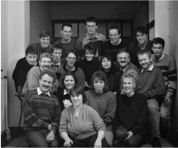
Het ROA in 1990