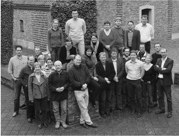
Het ROA in 2008