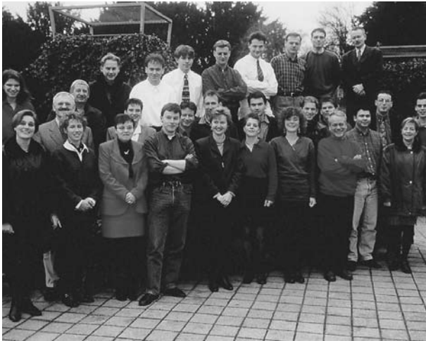
Het ROA in 1998