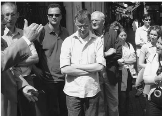
Jubileumuitje in Brussel ter gelegen- heid van 20 jaar ROA, 2006