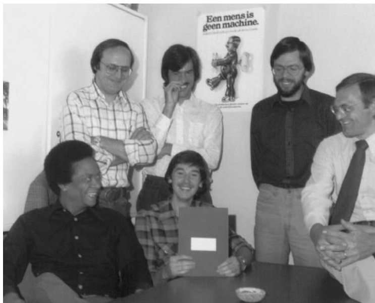
De afdeling Arbeidsmarkt van het NEI in juni 1979

De sollicitatie verliep voor mij positief en op 21 maart 1977 trad ik in dienst bij het NEI. Een personeelsafdeling bestond daar toen nog niet; het arbeidscontract werd opgesteld door de secretaris. Mijn eerste werkzaamheden betroffen de bijdrage aan een studie naar de problematiek van jongeren op de arbeidsmarkt. Tweede helft jaren zeventig was de jeugdwerkloosheid sterk gestegen. Reden voor het ministerie van Sociale Zaken (zonder nog de toevoeging Werkgelegenheid) een opdracht te verstrekken om de oorzaken van deze problematiek te achterhalen. Tijden veranderen. Nu behoort de jeugdwerkloosheid tot de laagste van alle leeftijdscategorieën. Slechts 6% van de ingeschrevenen bij CWI heeft eind 2007 een leeftijd jonger dan 25 jaar. De werkloosheid is inmiddels verschoven van de jongeren naar de ouderen.