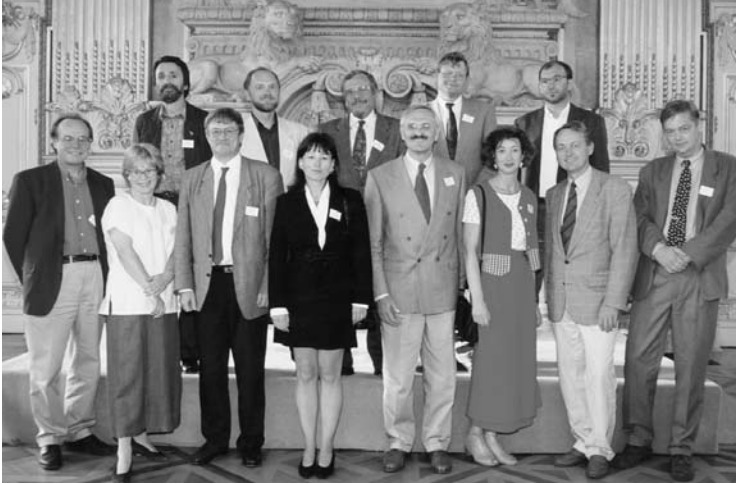
Het EALE-bestuur op de conferentie in Lyon, 1995