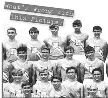
Figuur 2: Dezelfde jongen, steeds met wisselend haar.

Het zou veel belangrijker zijn om een precieze opgave van bijvoorbeeld de kleur van de ogen van de dader te krijgen, maar de beschrijvingen daarvan zijn, als zij al gegeven worden, meestal aanzienlijk vager: ogen zijn volgens getuigen vaak 'grijs/groen' of 'grijs/blauw'. Om die reden zijn beschrijvingen van dit soort kenmerken meestal alleen bruikbaar als het om extremen gaat, bijvoorbeeld als de dader helblauwe ogen had of gitzwart haar.