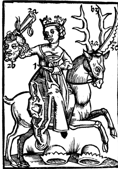
Kaart uit Murners Logica memorativa >

[Contra: John E. Murdoch, Album of science , III, Antiquity and Middle Ages , New York: 1984, 76-77]