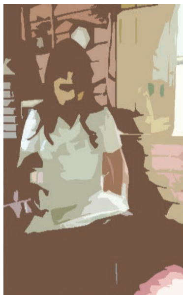
Figura 2. Foto no módulo de saúde, local de prática do curso de medicina da UFAC. Acadêmica bolsista do PJTC fazendo anotações no seu diário, após visita domiciliar.