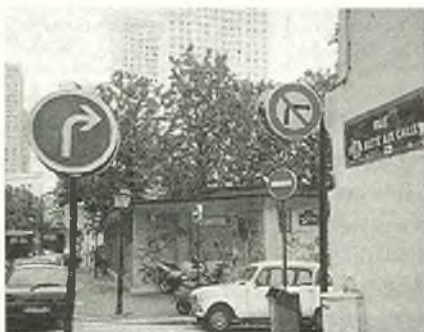
A Paris street corner