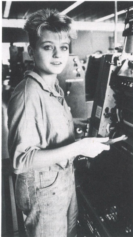
...doen mensen in het leerlingwezen waardevolle werkervaring op. Zeven jaar na het afsluiten van de opleiding is dit nog te merken.

De gunstige positie van mensen uit het leer- lingwezen kan aanleiding zijn het leerling- wezen als een „efficiëntere” opleidingsweg voor jongeren te betitelen. Immers in ver- gelijking met schoolverlaters uit het volledig dagonderwijs kennen de mensen uit het leerlingwezen vlak na het verlaten van de opleiding vrijwel geen aansluitingsproble- men, terwijl ook op de langere termijn geen nadelige effecten kleven aan een „oplei- ding in de praktijk”. Er schuilt echter een addertje onder het gras: voor de school- verlaters uit het leerlingwezen geldt immers dat een belangrijk deel van de selectie op de arbeidsmarkt zich al voor de opleiding heeft afgespeeld. Dit maakt een vergelijking in termen van efficiëntie vrij lastig omdat twee verschillende groepen vergeleken worden: mensen die het tot op zekere