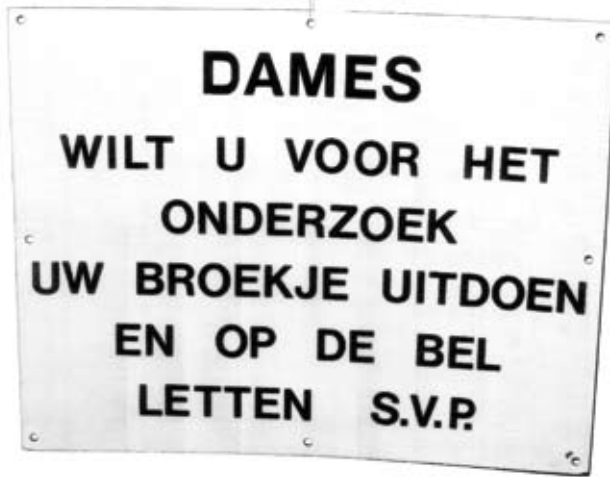
Figuur 1. Let op de bel s.v.p.