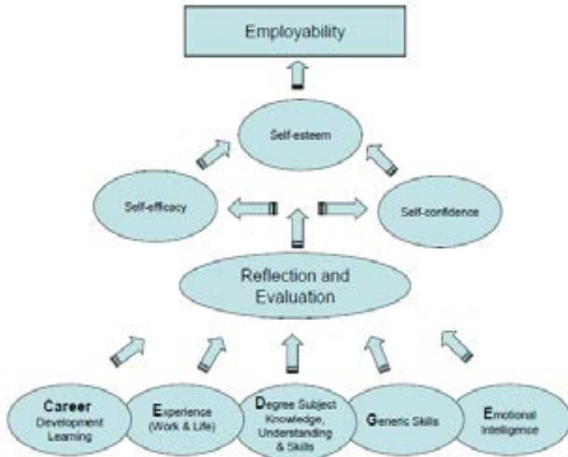
FIGUUR 3.2 Het 'key to employability' model (Dacre Pool & Sewell, 2007, p.284)

Aan de basis van het model staan vijf typen eigenschappen die studenten dienen te ontwikkelen en waar ze 'toegang' tot dienen te hebben: 'career development learning', 'experience', 'degree subject knowledge, understanding & skills', 'generic skills' en 'emotional intelligence'. De auteurs noemen dit gezamenlijk 'CareerEDGE', een combinatie van 'career development learning' en de beginletters van de andere vier eigenschappen. Het reflecteren over en evalueren van deze 'CareerEDGE'-eigenschappen leidt volgens het model tot een bepaalde mate van 'self-efficacy', 'self-esteem' en 'self-confidence', hetgeen vervolgens de cruciale verbinding is met 'employability'. We bespreken de verschillende elementen uit model hier kort: