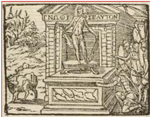
Figuur 2: 'Gnothi Seauton', 'ken uzelf', oud-Grieks aforisme. Gravure komt uit Picta poesis (1552) van Barthélemy Aneau, een Frans dichter en humanist.

Vanuit de ontstaansgeschiedenis van de psychotherapie valt goed te typeren wat psychoanalytici en psychotherapeuten in de negentiende en twintigste eeuw met psychotherapie wilden bewerkstelligen. Mede door de opkomst van het empirisme en de wetenschap in de negentiende eeuw, maakten klassieke thema's zoals de verhouding tussen lichaam en ziel, het zoeken naar moraal en absolute waarheden, plaats voor een nieuwe visie op de mens, de mens als een autonoom en verantwoordelijk individu. Het streven naar zelfkennis, al populair in de verlichting, kwam op een nog hoger plan en beïnvloedde het ontstaan en de ontwikkeling van de psychotherapie (Bakker, van Melsen, & van Peursen, 1985; Mahoney, 1991). Zowel de psychoanalyse als de humanistische psychotherapie hadden tot doel zelfinzicht te bewerkstelligen en daarmee de mens te bevrijden van symptomen. De methode daartoe was zelfinzicht en de ontwikkeling van het zelf (Figuur 2), op vergelijkbare wijze als Socrates dat deed in het Athene van de vierde eeuw voor Christus. Het helende gesprek stond centraal. In dat gesprek kon de patiënt zichzelf onder ogen komen.