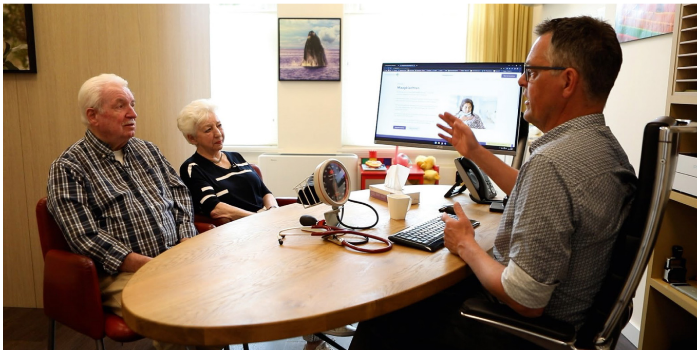
Het gesprek met de patiënt over welk beleid het beste past stimuleert de actieve betrokkenheid van de patiënt bij de besluitvorming.

Tijdens de eerste fase van samen beslissen is het cruciaal om de patiënt te stimuleren om actief te luisteren. De overige fasen lopen in de praktijk vaak door elkaar, en kunnen verspreid over